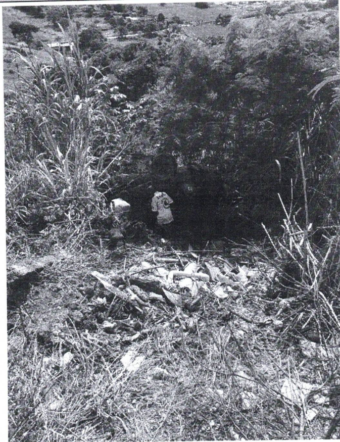
Foto 1 – Acidente ocorrido na rua Antônio Pereira Leite no dia 15 de janeiro de 2022